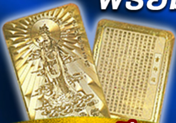
แถมฟรี แผ่นทองเจ้าแม่กวนอิม