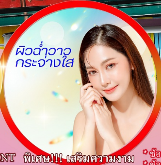
ผิวด้าวาว กระจางใส