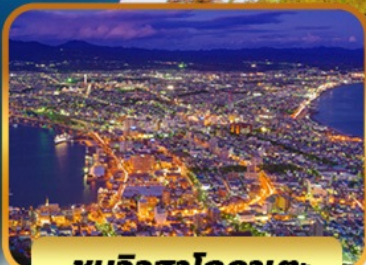
ชมวิวฮาโกดาเตะ

SPECIAL PROMO จอง 10 ท่านแรก ลด 2,000 บาท