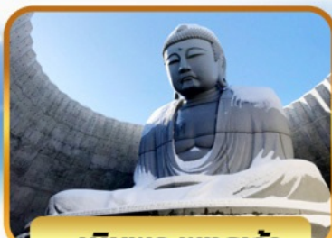
เป็นพระพุทธรเจ้า