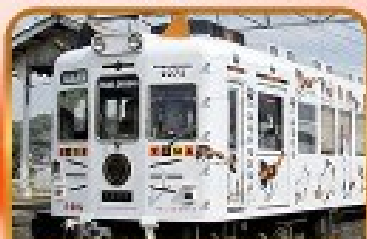
บั้งรถไฟทามาะจัง