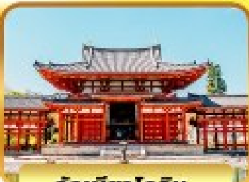
วัดเบียวโดอิน