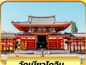
วัดเบียวโดอิน