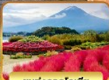
ชมทุ่งดอกโคเชีย