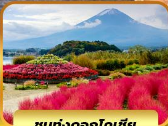
ชมทุ่งดอกโคเชีย