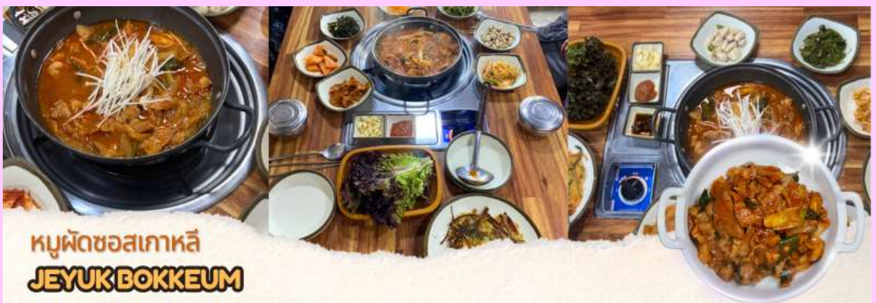
หมูผัดซอสเกาหลี JEYUK BOKKEUM