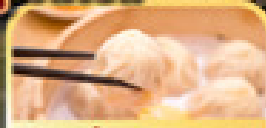
เสี่ยวหลงเปา