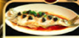
ปลาประจักษ์ริบตี