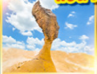
อุทยานเหย่หลิว

เที่ยวเต็ม!! ไม่มีวันอิสระ แช่น้ำแร่ในห้องพักส่วนตัว