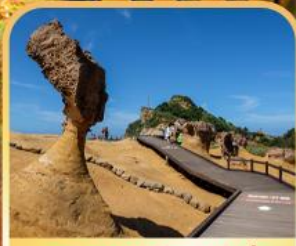
อุทยานหินเหย์หลิว