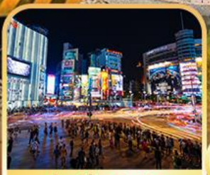
ย่านซีเหมินติง