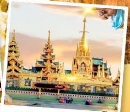
เจดีย์กลางน้ำ (สิเรียม)