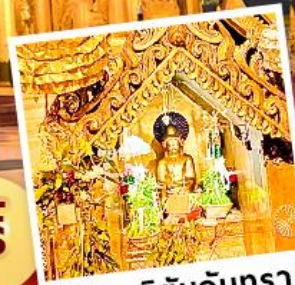
พระสุริยันจันทร