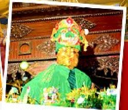
ขอพรแม่ยักยี