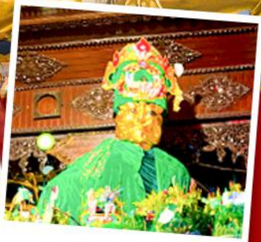
ขอพระแม่ยักษ์