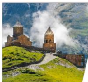
โบสถ์เกอร์เกตี