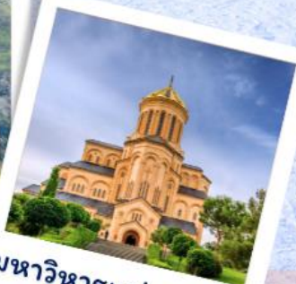
มหาวิหารแห่งทบิลีซี