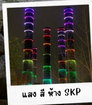
แสง สี ห้าง SKP