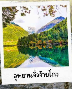
อุทยานจี๋จ้ายโกว