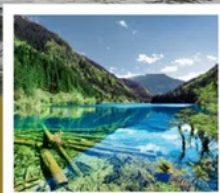
จั๋วจ้ายโกว