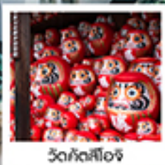
วัดคังสึโฮจิ