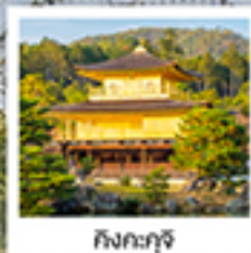
กิงกะกุจิ