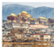
เมืองโบราณแชงกริล่า