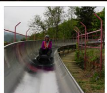
สไลเดอร์ลงจากกำแพงเมืองจีน