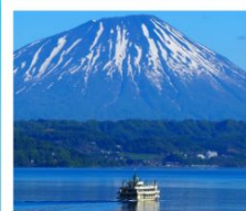
ช่องเรือทะเลสาบโทยกะ