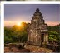
เขมบาคี้ง