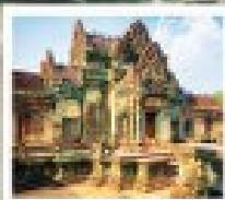
ปราสาทบันทายสี