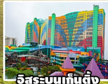
อิสระบนเก็นติ้ง