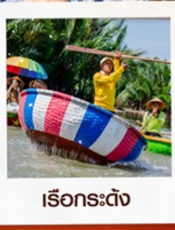
เรือกระดังง์