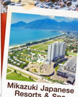
Mikazuki Japanese Resorts & Spa