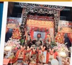
เทพเจ้ากวนอู วัดกวนไท่