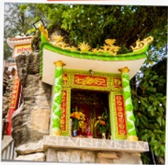
ศาลเจ้าติงซาอว