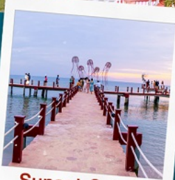
Sunset Sanato Beach Club