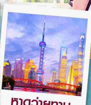
ทาดว่ายกาน