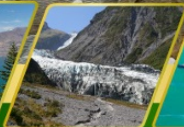
ธารน้ำแข็ง FOX GLACIER