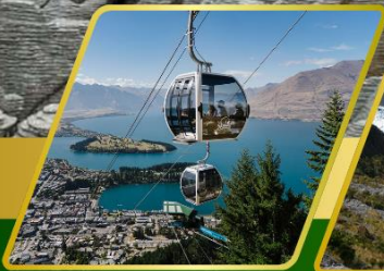
นั่งกระเช้าคอนโดล่า รับประทานอาหาร บนยอดเขานับพันฟุต