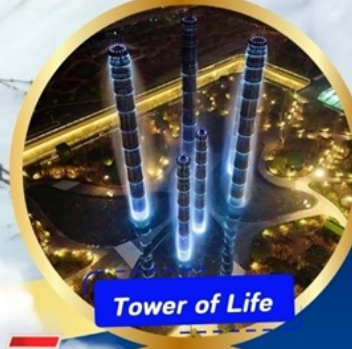
Tower of Life