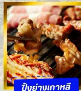
ปิ้งย่างเกาหลี