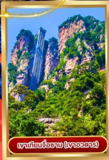
เขาเทียนจื่อซาน (เขาวงกต)

• ตึกมหัศจรรย์ 72 ชั้นแห่งเมืองจางเจียเจีย