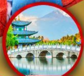
สระมั่งกรต้า