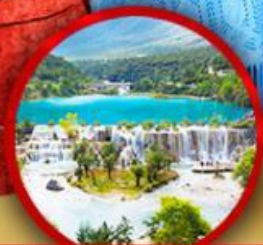
หุบเขาพระจันทรสีน้ำเงิน