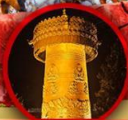
วัดต้าฝื่อ (ทงล้อทองคำ)