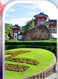
อุทยานหนานชาน