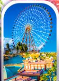
เมืองแฟนตาซี