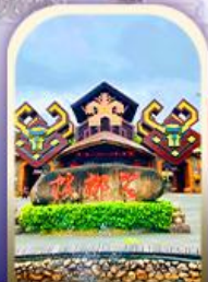
หมู่บ้านชนเผ่า