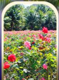
ทุ่งอ่าวย่าหลง