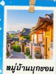
หมู่บ้านนุกซอน