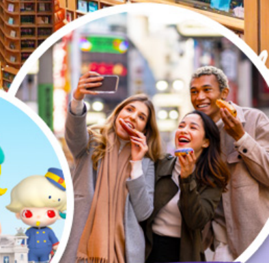
ตลาดเมียงดง