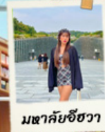
มหาชัยชีวา