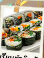
เรียนทำคิมบัม