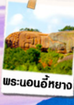
พระนอนอภัย