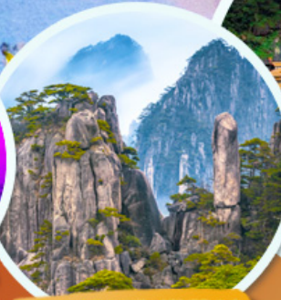
ภูเขาหวงชาน