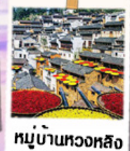
หมู่บ้านทวงหลิง