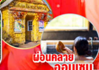
ผ่อนคลาย ออนเซน..

ไฮไลท์!! เมืองในฝันสไตลยุโรปในประเทศญี่ปุ่น HUIS TEN BOSCH สัมผัสความยิ่งใหญ่ ปราสาทคามาโมโตะ 1 ใน 3 ปราสาทที่ใหญ่ที่สุดญี่ปุ่น พบกับ ถิ่นดื่มด่ำใหม่ขนาดเท่าของจริง ณ ถิ่นดื่ม ปาร์ค ฟุกุโอกะ ชม บ่อนรก จิโตะ เมกูริ บ่อนรกแห่งเมืองเบปปุ อ่างน้ำแร่ธรรมชาติ (ออนเซน)