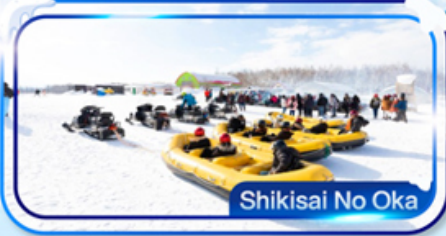
สนุกสนาน ณ ลานสโนว์