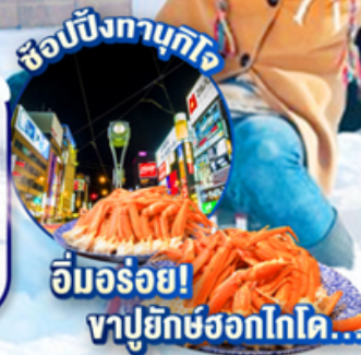
อิมพอร์ต! ซาปูยักซ์ฮอกไกโด...