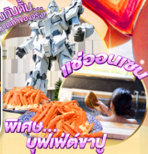
ซุกกินดื่ม... พูฟไฟเตาญี่ปุ่น