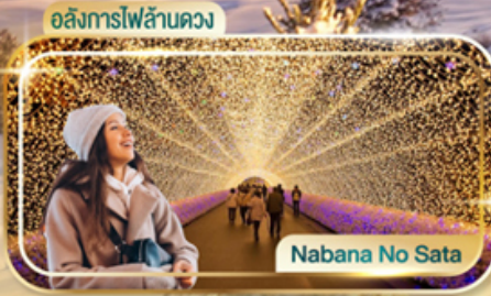
Nabana No Sata

รวมภาษีมูลค่าเพิ่ม 7% (ส่วนของค่าบริการท่านั้น)