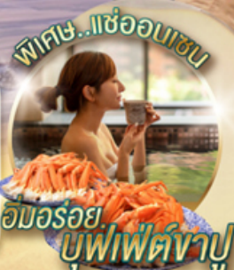
ออนเซ็น บุฟเฟ่ต์ใหญ่

ไฮไลท์!! อลังการไฟลั่นดวง ณ หมู่บ้านนาบาระ โนะ ซาโตะ เล่นสกี ณ พูจิกินสกีรีสอร์ท ที่จากหลังจะเป็น ภูเขาไฟฟูจิ น้ำตกชิราอิโตะ น้ำตกที่ศักดิ์สิทธิ์และขึ้นทะเบียนเป็นมรดกโลก บุฟเฟ่ต์ใหญ่ และผ่อนคลายกับการแช่น้ำแร่ธรรมชาติ (ออนเซ็น)