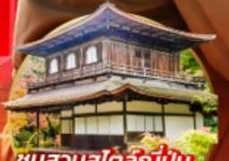
ชมสวนสโตนี่ญี่ปุ่น... Ginkakuji Temple