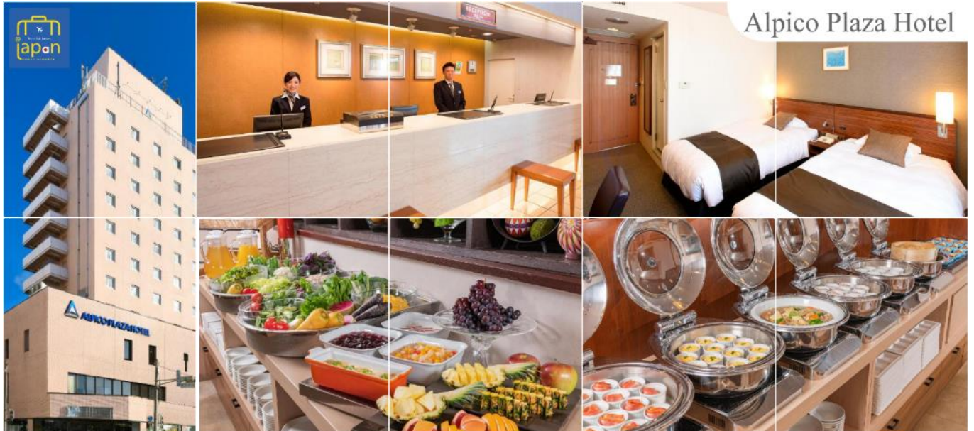
Alpico Plaza Hotel

พักที่ ALPICO PLAZA HOTEL หรือเทียบเท่าระดับเดียวกัน