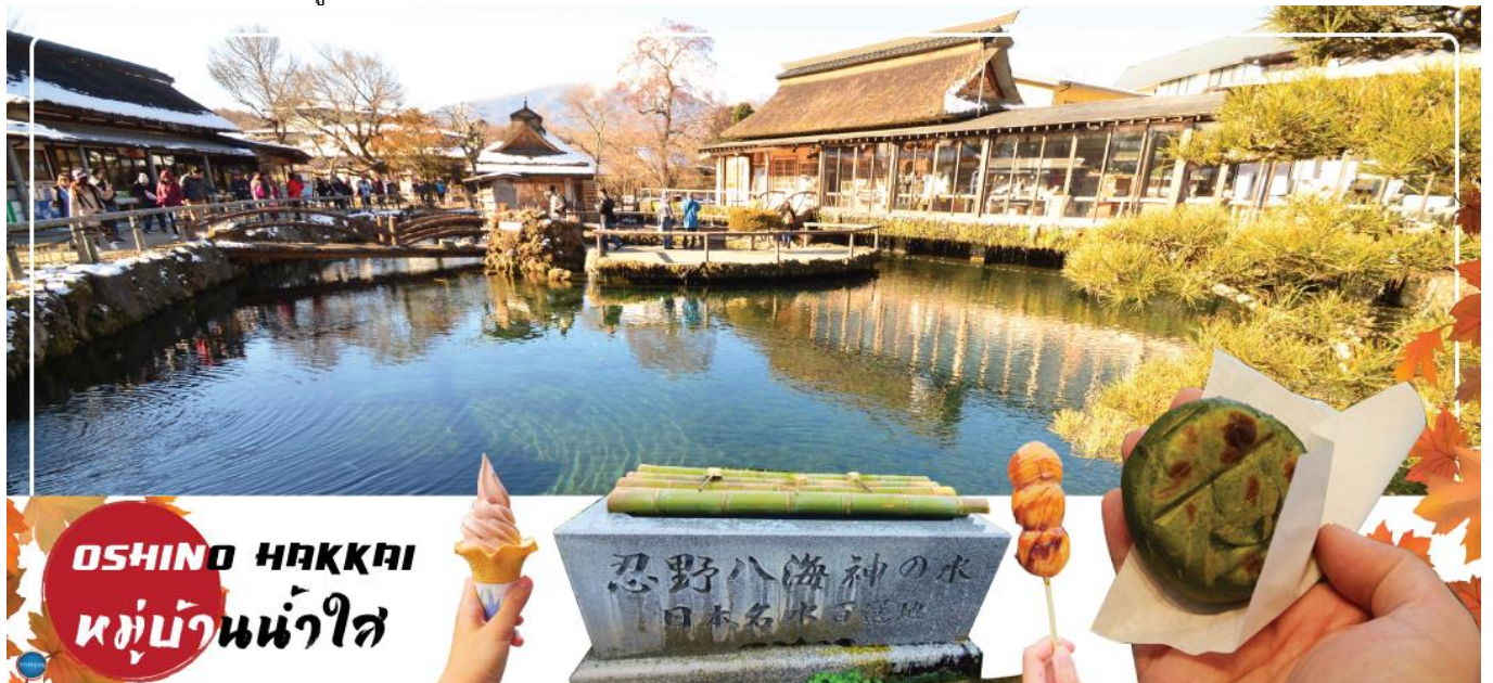
OSHINO HAKKAI หมู่บ้านน้ำใส

นำท่านชม หมู่บ้านโอชิโนะฮักไก (Oshino Hakkai) เป็นในช่วงฤดูใบไม้เปลี่ยนสีเป็นจุดท่องเที่ยวสำคัญอีกสถานที่หนึ่ง โดยมีวิวภูเขาไฟฟูจิสีขาวตัดกับพื้นหลังสีฟ้า และใบไม้เปลี่ยนสี สีเหลือง แดง ส้ม เป็นภาพที่สวยงามมาก โอชิโนะฮักไกเป็นหมู่บ้านเล็กๆ ประกอบด้วยบ่อน้ำ 8 บ่อในโอชิโนะ ตั้งอยู่ระหว่างทะเลสาบคาวากูจิโกะ กับทะเลสาบยามานาคาโกะ บ่อน้ำทั้ง 8 นี้เป็นน้ำจากหิมะที่ละลายในช่วงฤดูร้อน ที่ไหลมาจากทางลาดใกล้ภูเขาไฟฟูจิผ่านหินลาวาที่มีรูพรุนอายุกว่า 80 ปี ทำให้น้ำใสสะอาดเป็นพิเศษ นอกจากนี้ยังมีร้านอาหาร ร้านจำหน่ายของที่ระลึก และชมรมอบๆบ่อที่ขายทั้งผัก ขนมหวาน ผักดอง งานฝีมือ และผลิตภัณฑ์ท้องถิ่นอื่นๆ อีสาระให้ท่านได้เพลิดเพลินกับการถ่ายรูปและซื้อของที่ระลึกตามอัธยาศัย