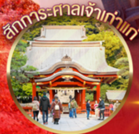
สักการะศาลเจ้าเก่าแก่