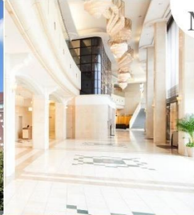
Marroad international Hotel Narita