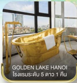
GOLDEN LAKE HANOI โรงแรมระดับ 5 ดาว 1 คืน