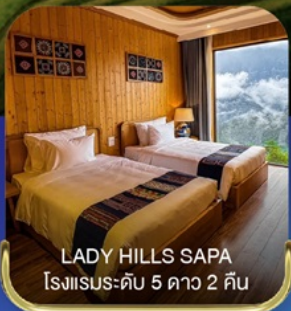
LADY HILLS SAPA โรงแรมระดับ 5 ดาว 2 คืน