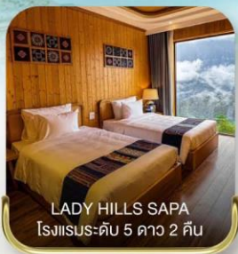
LADY HILLS SAPA โรงแรมระดับ 5 ดาว 2 คืน