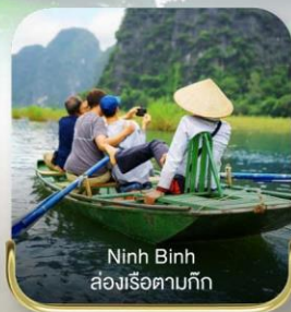
Ninh Binh ล่องเรือตามทิว