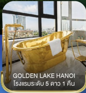
GOLDEN LAKE HANOI โรงแรมระดับ 5 ดาว 1 คืน