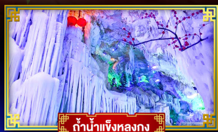
ก้าน้ำแข็งหลงกง

"เที่ยว 2 มณฑล กวางซี-กัชโจว" สุดอลังการ น้ำตก 2 พรมแดน แหล่งท่องเที่ยวระดับ 5A