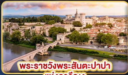
พระราชวังพระสันตะปาปา แห่งอเวียง