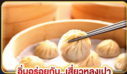
อึ้งอร่อยกับ..เสี่ยวหลงเปา

พิเศษ !! หม้อนึ่งจักรวาล, ไอศกรีม MIYAHARA