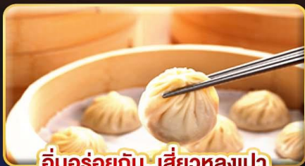
อึ้งอร่อยกับ...เสี่ยวหลงเปา

พิเศษ !! หม้อนึ่งจิวสวรดี้ ,ไอศกรีม MIYAHARA