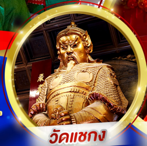
วัดเซกวง

ขอพรองค์พ่อเซกวง หมุนกังหันเปลี่ยนชีวิต ยืมเงินเจ้าแม่กวนอิมสองอ้า ซอปปึงย่านมงก๊อก