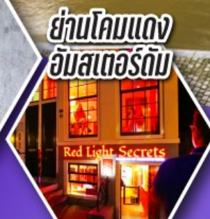
ย่านโคมแดง อัมสเตอร์ดัม