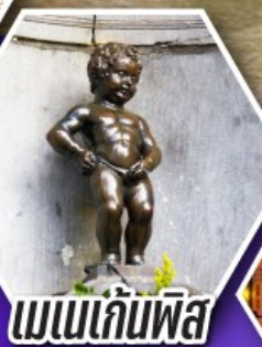
แมนเกินฟิส