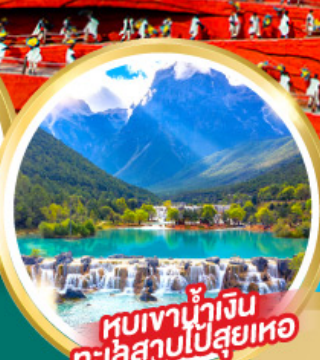
ชมเขาน้ำเงิน ทะเลสาบไป๋สือเหอ