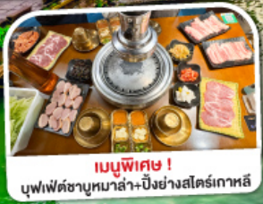
เมนูพิเศษ! บุฟเฟ่ต์ชาบูหม่าล่า-ปิ้งย่างสไตล์เกาหลี