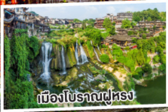
เมืองโบราณฟูหรง