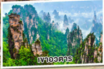
เทาอวตาร