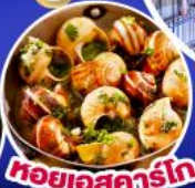
หอยเอสคาร์โก