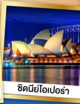
ซิดนีย์โอเปร่า