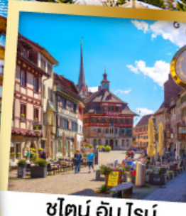
ชไตน์ อัม โรน์