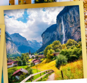
เลาเทอร์บรุนเนิน