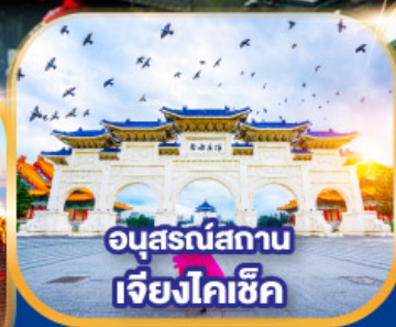
อนุสรณ์สถาน เจียงไคเช็ค