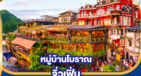
หมู่บ้านโบราณ จิวเฟิ่น