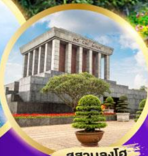
สุสานลุงโฮ