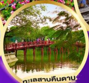
ทะเลสาบคินดาบ